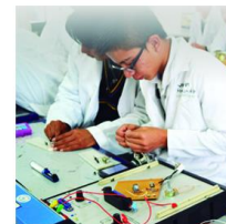
BECAS DE CAPACITACIÓN (ANTES CAPACITA-T)