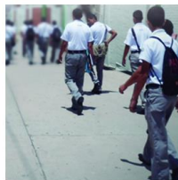
BECA DE MANUTENCIÓN MODALIDAD ABANDONO ESCOLAR

Este tipo de apoyos de solicitud permanente requiere que el Comité Institucional de Becas de tu plantel te proponga (postule) con candidato para obtener una beca, para ello sólo tienes que cumplir con los requisitos particulares de cada modalidad. PIDE INFORMES AL ÁREA DE BECAS DE TU PLANTEL.