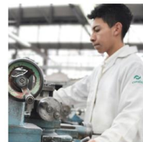
BECA SALARIO (FORMACIÓN DUAL)